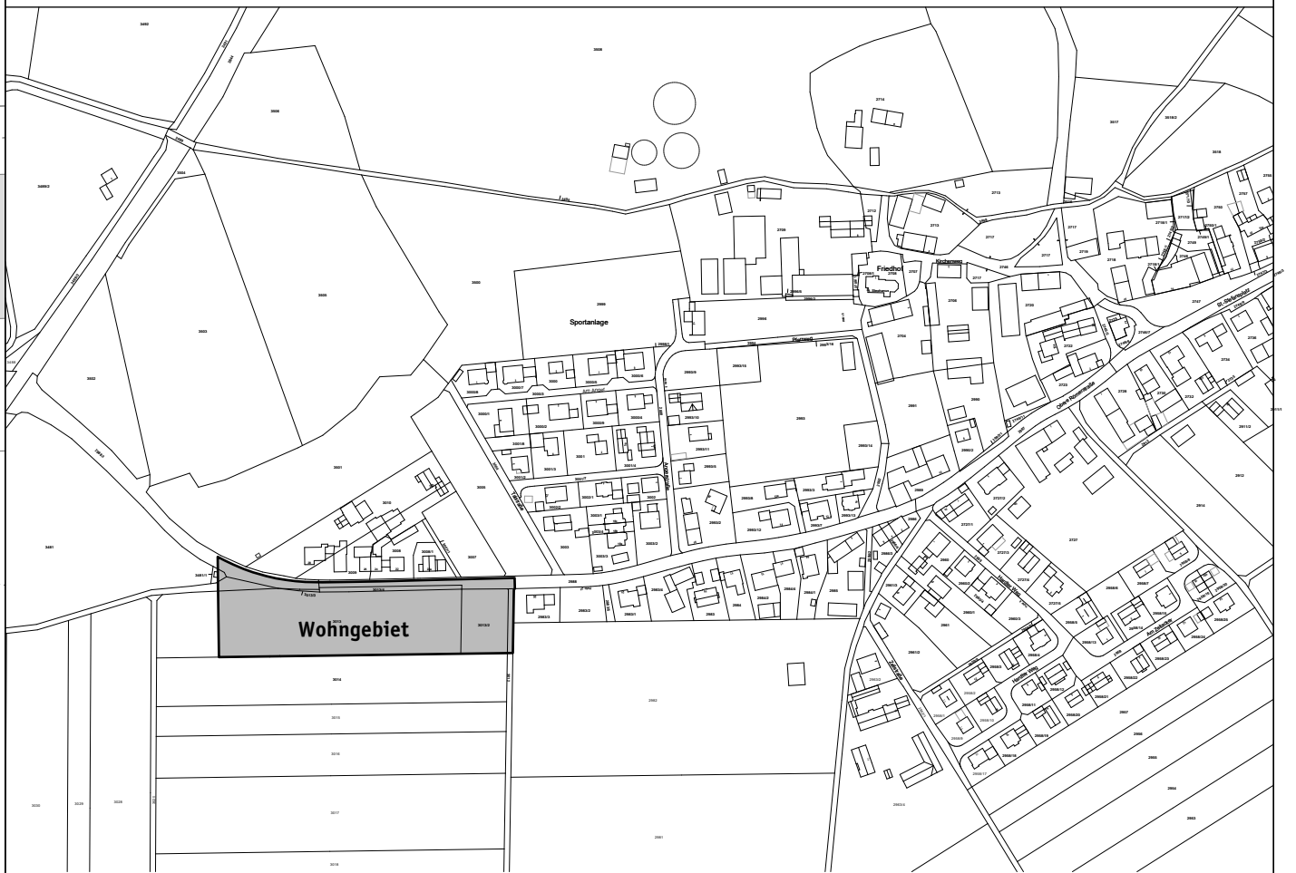
Lageplan M 1:5.000